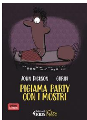
John Dickson Pigiama party con i mostri Feltrinelli

Il re e la regina desiderano un figlio ormai da anni. Finalmente, le loro speranze vengono esaudite, sotto forma di un robotto di legno e di una principessa incantata, fatta con un ciocco di legno. C'è solo un piccolo inghippo: ogni sera, la principessa torna a trasformarsi in un ciocco. Quando la principessa viene scambiata per un pezzo di legno qualunque, suo fratello decide di salvarla - ed è qui che comincia la loro avventura. Età di lettura: da 6 anni.