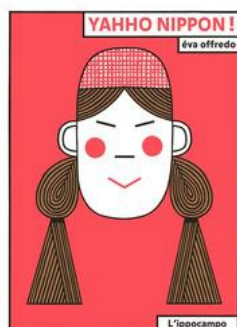
Eva Offredo Yahho Nippon! L'ippocampo

I libri a volte mentono, si sa, ma questo no. Questo libro dice sempre la verità. Parola di Gedeone, che è quel tizio basso e grasso sulla copertina, ricco sfondato e con un cane gigantesco e terribile. E questo libro non è affatto divertente e non fa neanche voglia di vedere cosa succede a quegli antipatici dei personaggi. Anche perché lo ha scritto e illustrato un tale che non ha mai pubblicato neanche un libro in vita sua, che non ha mai vinto lo straccio di un premio e che probabilmente non troverà mai un editore.