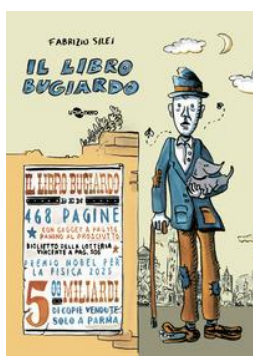
Fabrizio Silei Il libro bugiardo Uovonero

Avete mai sentito un mostro sotto al letto? Be', in questo libro ne troverete così tanti da poterci fare... una festa! "Quando fa buio e sono già a letto arrivano i mostri qui di soppiatto. Uno è molliccio di gelatina, altri un'oscura nebbiolina, alcuni hanno corna, verruche e artigli, grinfie affilate e occhi vermigli!" Un libro spassoso e bizzarro da cui poter imparare una preziosa lezione: di fronte alle nostre paure a volte la soluzione è... buttarsi nella mischia! Età di lettura: da 6 anni.