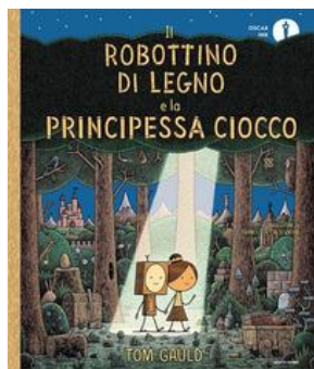
Tom Gauld Il robotto di Legno e la Principessa Ciocco Mondadori

scioglimento dei ghiacciai... mettendo alla prova le sue abilità! Con una matita e un po' di concentrazione si parte per una missione sempre diversa che appassionerà il piccolo lettore!