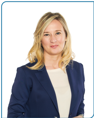
Alessia Bevilacqua Sindaco di Arzignano