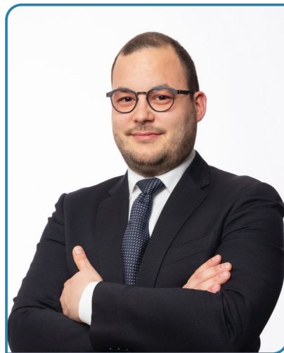
Filippo Negro Sindaco di Chiampo