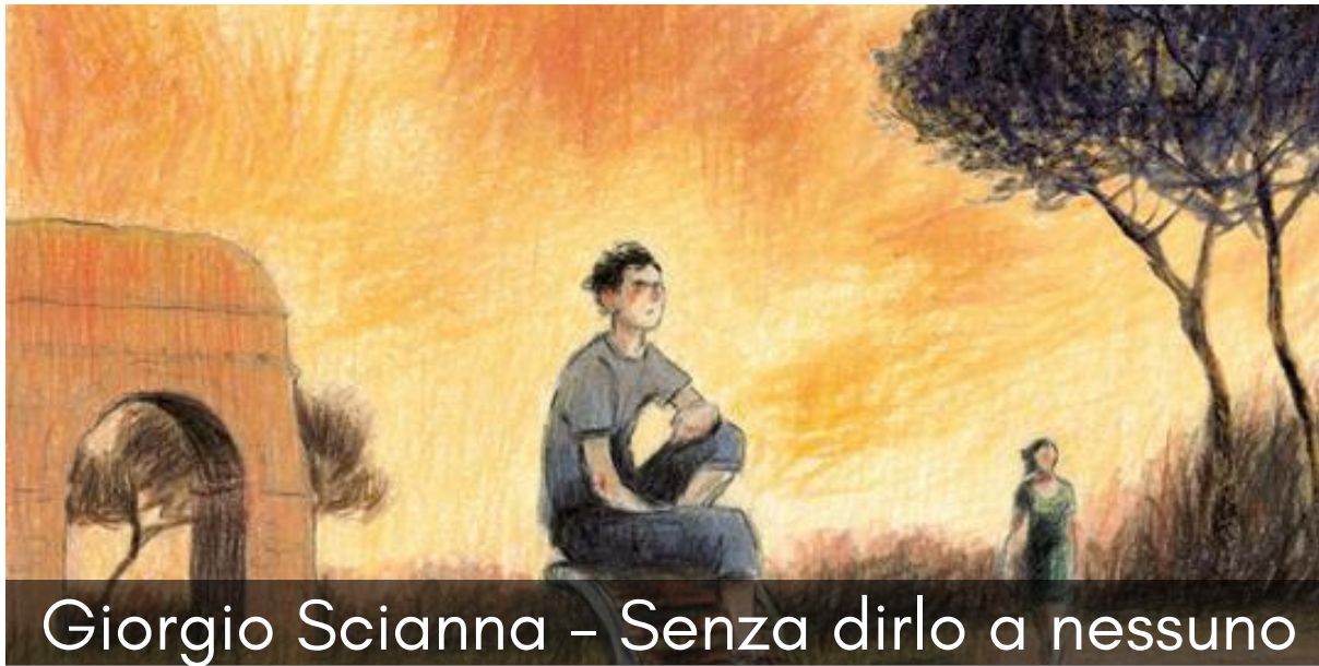
Giorgio Scianna - Senza dirlo a nessuno

Scianna ci consegna una storia potente , che pone le giuste domande. Nell'attenzione che questo autore dedica ai giovani , sta il segno di una sensibilità che, particolarmente oggi, è preziosa.